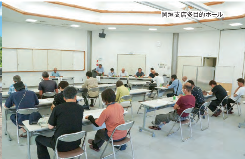
岡垣支店多目的ホール