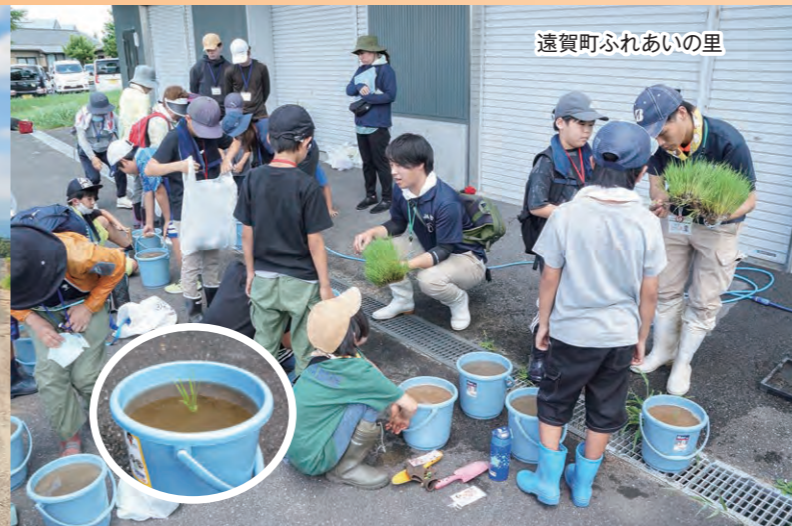
遠賀町ふれあいの里