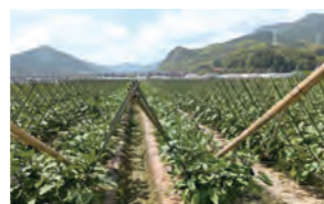
整備されたほ場。排水対策も しっかりおこなっています

これまで新規就農者支援の取り組みをつづけた結果、小倉南区は多くの新規就農者を迎えることができました。