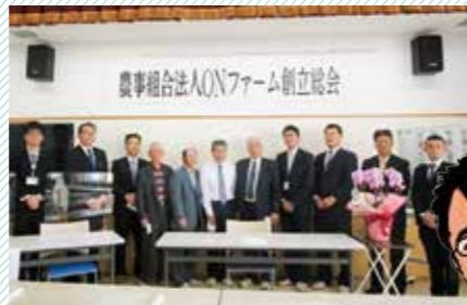
一人で法人運営の支援ができるように勉強中です!