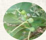
実り始めたオリーブ