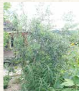
庭に植えられたオリーブやイチジクの木