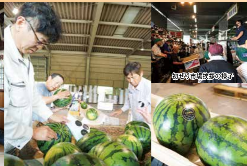
初ざり市場挨拶の様子