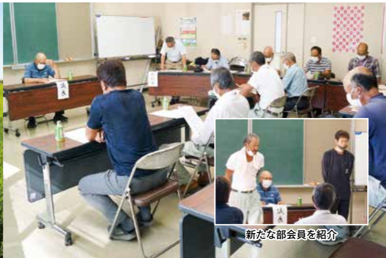
新たな部会員を紹介