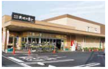
はくさい菜は近隣のスーパー、農産物直売所大地の恵みでご購入できます

北九州市のポピュラー野菜がまた、多くの消費者へ届くよう、はくさい菜生産者、東部営農職員全体で力を合わせ、出荷量向上に努めていきます。